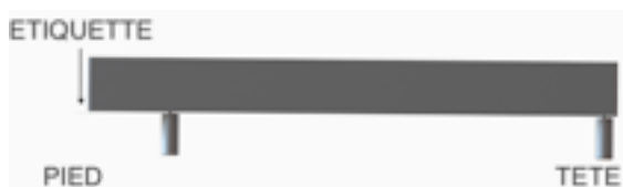
Configuration pieds décalés